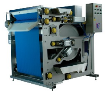
Pressoir à bande