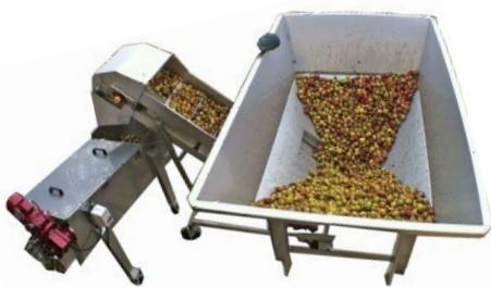
Réception et laveuse de pommes