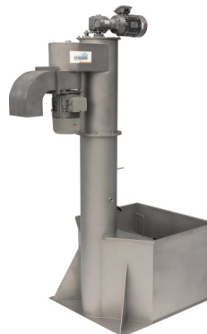
Broyeur à pommes